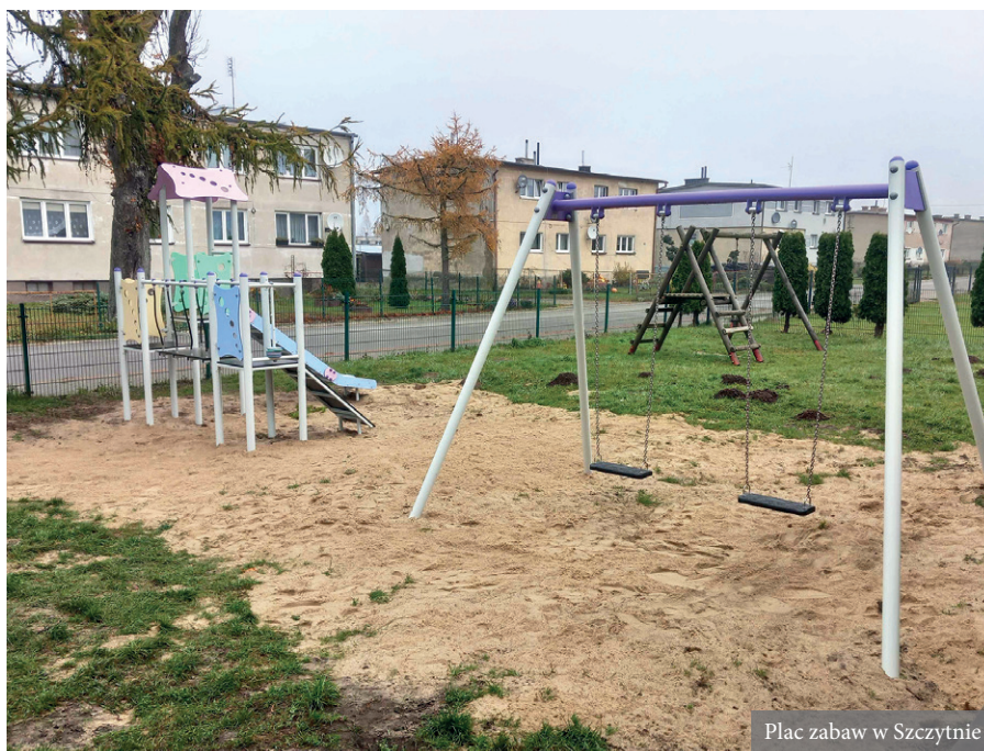
Plac zabaw w Szczytnie