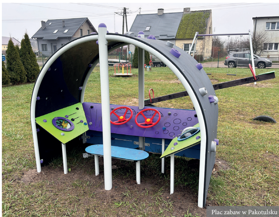
Plac zabaw w Pakotulsku

W tej chwili trwają prace związane z aktualizacją dokumentacji, która umożliwi modernizację kolejnych placów zabaw. W planach jest między innymi budowa altany w Garbku oraz wiaty wypożyczkowej w Lisewie. W Płaszczycy zmieniona będzie nieco lokalizacja obiektu. W Przechlewie przy szkole powstanie zupełnie nowy obiekt. Gotowa jest już jego dokumentacja techniczna. Samorząd liczy na dofinansowanie zewnętrzne dla tej inwestycji.